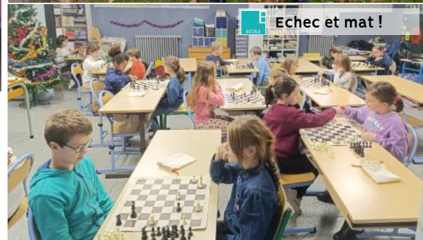
Echec et mat !