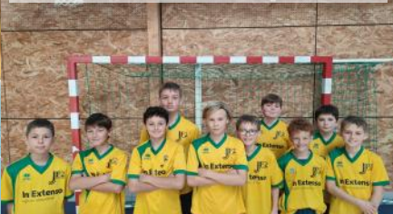
Equipe Benjamins Garçons Trisport