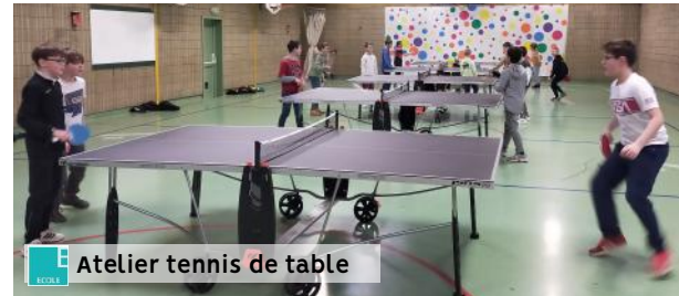
Atelier tennis de table