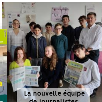
La nouvelle équipe de journalistes