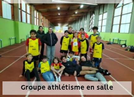
Groupe athlétisme en salle