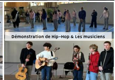
Démonstration de Hip-Hop & Les musiciens