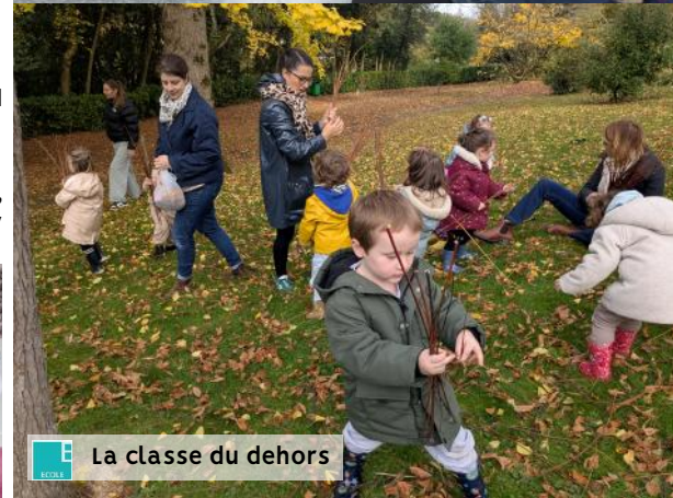
La classe du dehors