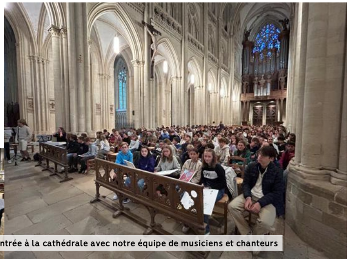
Messe de rentrée à la cathédrale avec notre équipe de musiciens et chanteurs