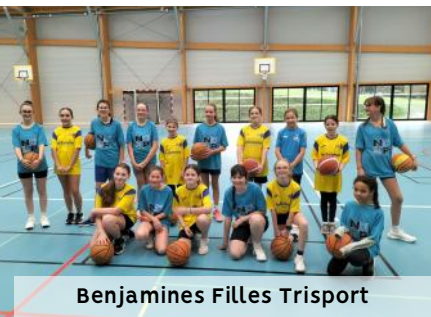
Benjamines Filles Trisport