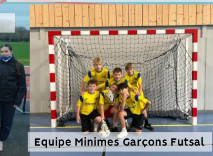
Equipe Minimes Garçons Futsal