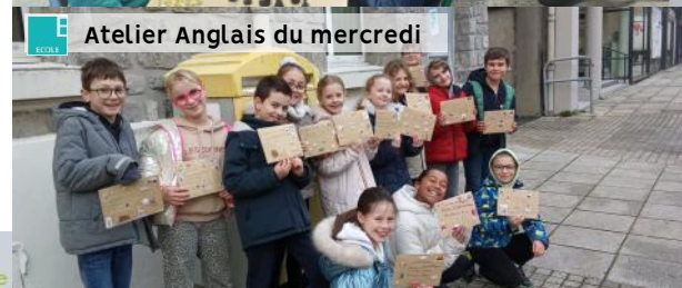
Atelier Anglais du mercredi