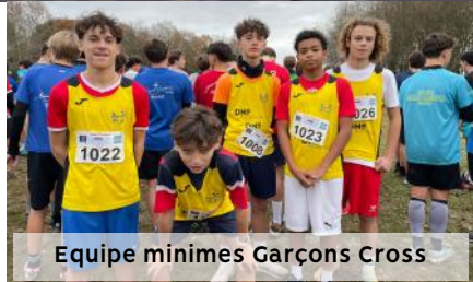
Equipe minimes Garçons Cross