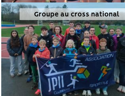
Groupe au cross national