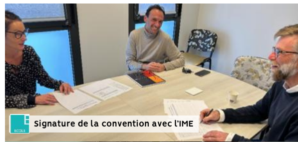
Signature de la convention avec l'IME

180 élèves des écoles de Coutances (Ecole des Tanneries, IME La rose des Vents, CE2 de Jean-Paul II) et Granville participent à ce projet qui se clôturera en mai par un baptême de l'air pour chaque enfant.