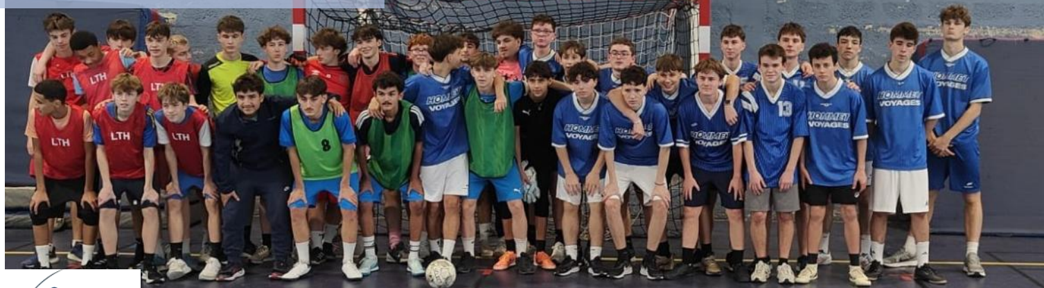
Equipe Futsal Cadets Juniors Garçons