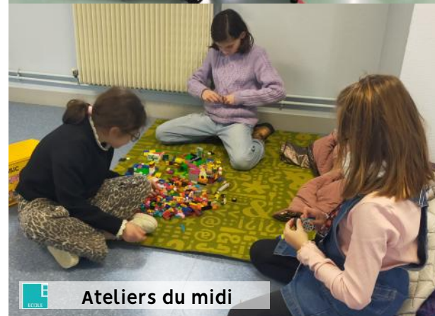
Ateliers du midi