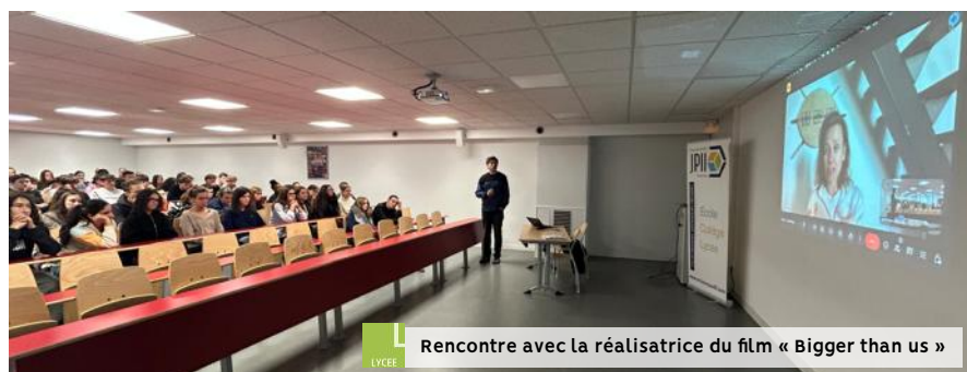
Rencontre avec la réalisatrice du film « Bigger than us »