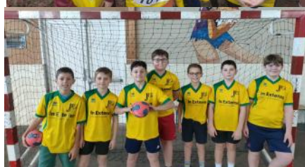
Equipe Benjamins Garçons Trisport