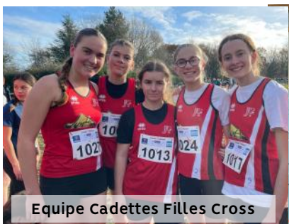
Equipe Cadettes Filles Cross