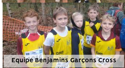
Equipe Benjamins Garçons Cross