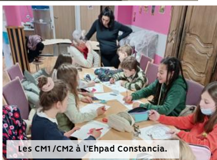
Les CM1/CM2 à l'Ehpad Constanica.

A l'occasion des préparatifs des fêtes de fin d'année, les élèves de CM1/CM2 ont rencontré leurs aînés de l'Ehpad Constanica. D'autres moments de partage sont déjà programmés dans l'année.