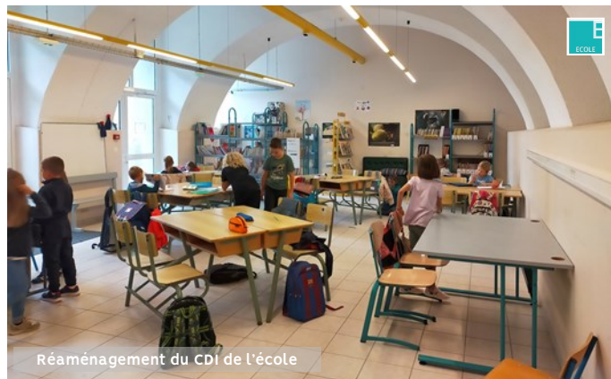
Réaménagement du CDI de l'école