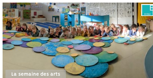
La semaine des arts