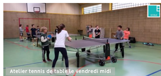
Atelier tennis de table Le vendredi midi

Un atelier jardin qui se poursuit cette année avec des élèves de 5e en continuité de ce qui s'est initié l'an dernier !