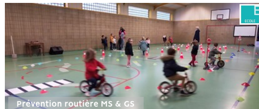
Prévention routière MS &amp; GS