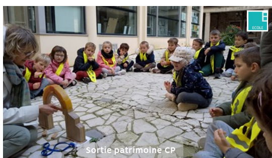
Sortie patrimoine CP