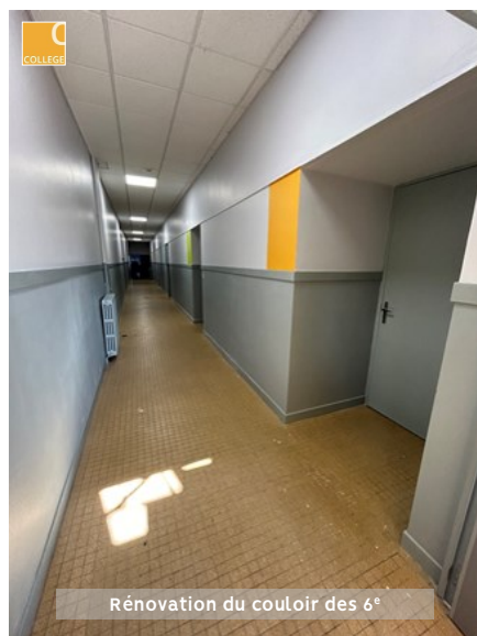
Rénovation du couloir des 6 e