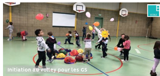
Initiation au volley pour les GS