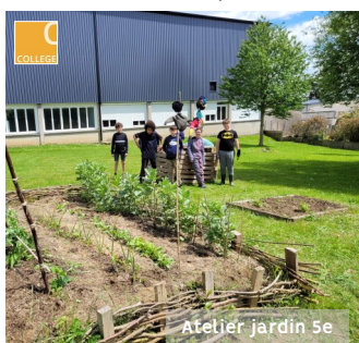
Atelier jardin 5e

Le 7 juin dernier, la troupe de théâtre du collège et du lycée a eu le plaisir de se retrouver sur les planches du TMC pour une soirée mémorable et de grande qualité !