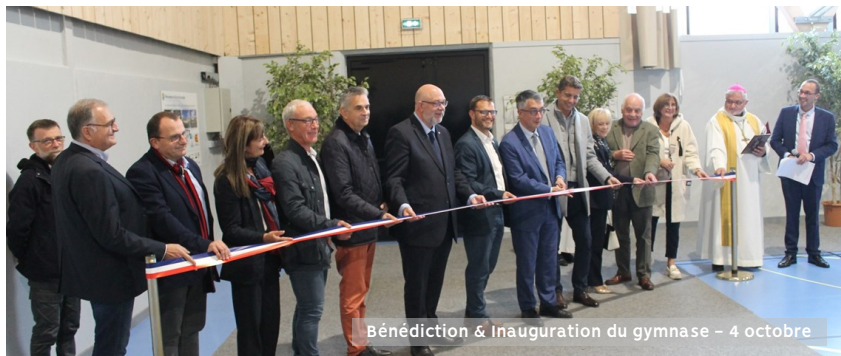
Bénédiction & Inauguration du gymnase – 4 octobre