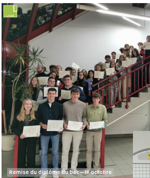
Remise du diplôme du bac—19 octobre

Des élèves se sont distingués par leur très beau score. Notre établissement a obtenu des scores supérieurs aux moyennes nationales et départementales.