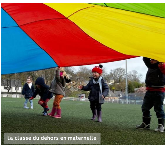
La classe du dehors en maternelle