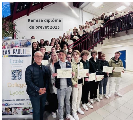
Remise diplôme du brevet 2023