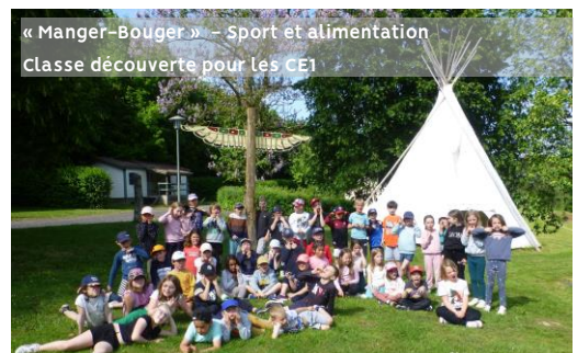
« Manger-Bouger » – Sport et alimentation Classe découverte pour les CE1