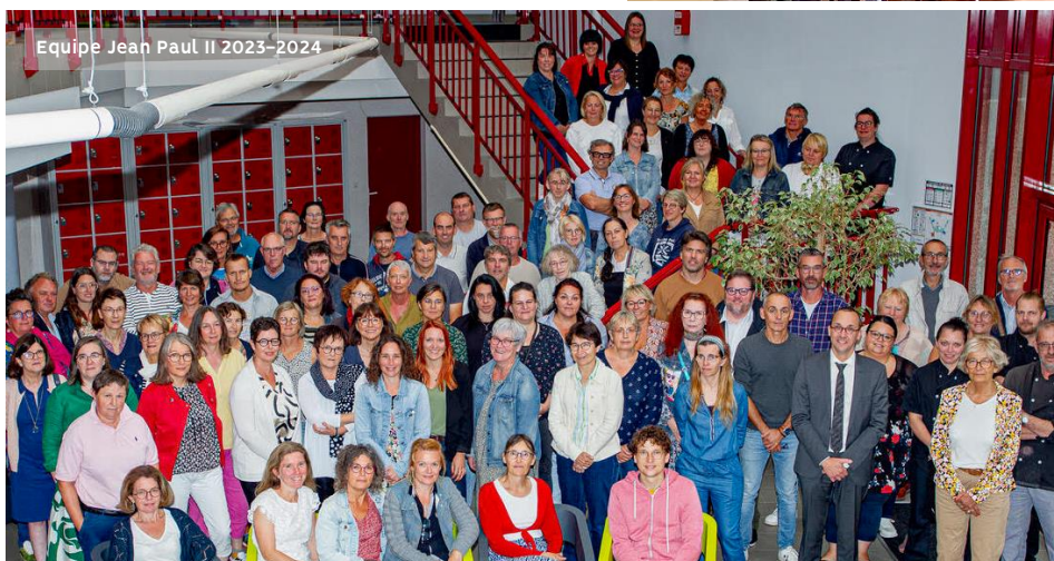
Equipe Jean Paul II 2023-2024

Retrouvez l'équipe sur la page du site internet de l'établissement