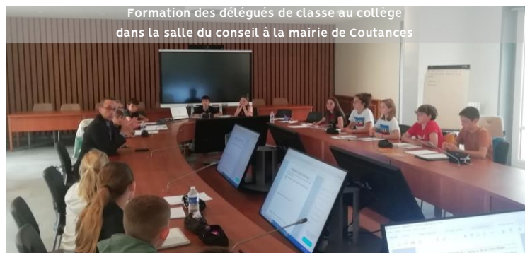
Formation des délégués de classe au collège dans la salle du conseil à la mairie de Coutances