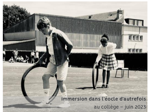
Immersion dans l'école d'autrefois au collège – juin 2023