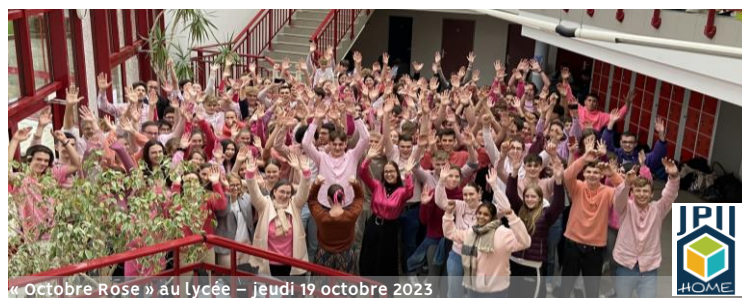
« Octobre Rose » au Lycée – jeudi 19 octobre 2023