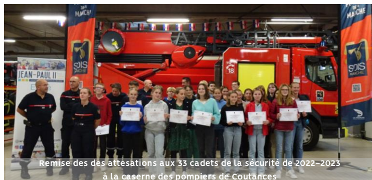
Remise des des attestations aux 33 cadets de la sécurité de 2022-2023 à la caserne des pompiers de Coutances