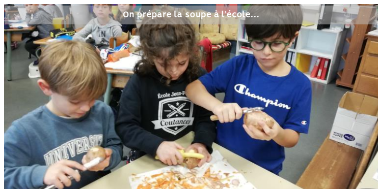
On prépare la soupe à l'école...