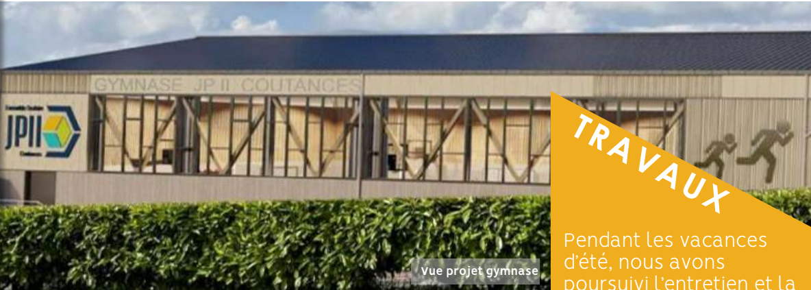
Vue projet gymnase